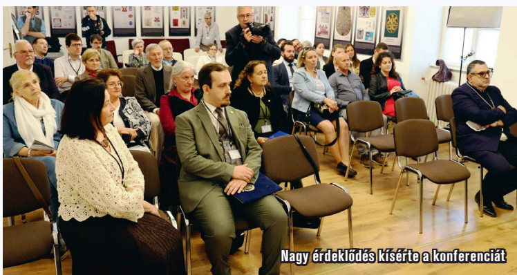
Nagy érdeklődés kísérte a konferenciát

A konferencia négy szekciójában a térség történetének számos aspektusa került terítékre. Az előadások foglalkoztak többek között Zsigmond király halasi kapcsolataival, Jakabszállás történetével, a középkori temetkezésekkel, a jászsági öltözködéskultúrával, valamint a kiskun településhálózat és a mezővárosi elit múltjával. A rendezvény tartalmas szakmai vitákkal zárult, ismét bizonyítva, hogy a Jászkunság kutatása ma is élő és folyamatosan megújuló tudományos terület.