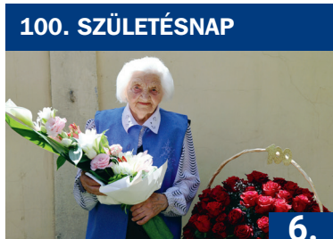
100. SZÜLETÉS NAP

XXXV. évfolyam 9. szám 2026. június 4. MEGJELENIK KÉTHETENTE