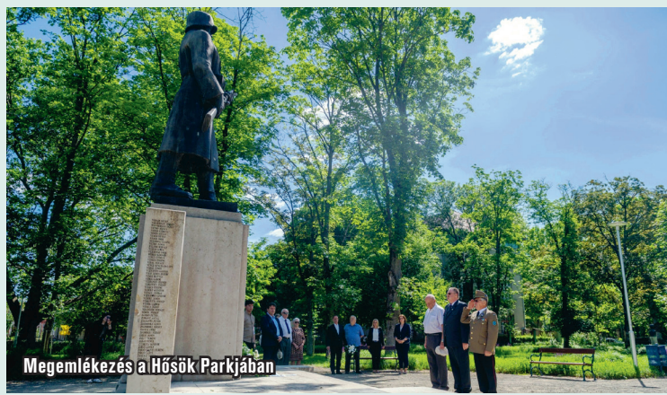
Megemlékezés a Hősök Parkjában