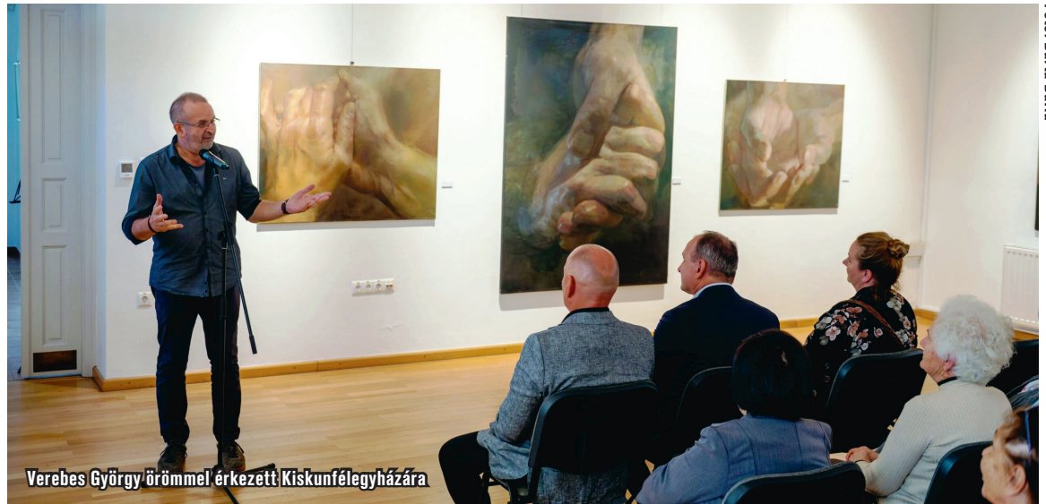
Verebes György örömmel érkezett Kiskunfélegyházára

„Ha körbenézünk ezeken a képeken, láthatjuk, hogy nemcsak a magyar nyelv képes rendkívüli kifejezőerőre, hanem az emberi test, a kéz mozdulatai is” – fogalmazott a városvezető, aki szerint Verebes György alkotásai különleges módon tárják fel az emberi érzések és gondolatok mélységeit.