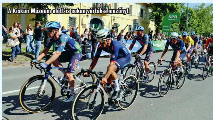
A Kiskun Múzeum előtt is sokan várták a mezőnyt