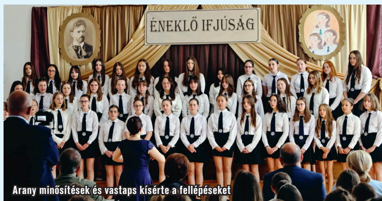
Arany minősítések és vastaps kísérte a fellépéseket