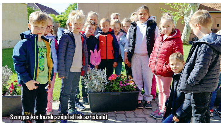
Szorgos kis kezek szépítették az iskolát

Hozzátette azt is, hogy a mostani támogatással több mint száz egyenlő és élhető növényt ültettek el a diákok az iskola udvarán lévő virágosládákba és magaságvasokba. Emellett a térközdvaron újrafestették az aktív szüneteket szolgáló ugróiskolákat és mozgásfejlesztő pályákat, valamint színes motívumokkal díszítették a magaságvasok oldalát.