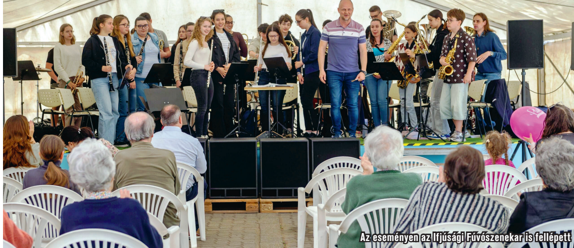
Az eseményen az Ifjúsági Fúvószenekar is fellépett

Színesebb programokkal, vidám hangulattal és közösségi élményekkel telt meg a Csanyi úti idősek otthonának udvara a jubileumi, tizedik Szivárvány Majálison. A rendezvényre rengetegen látogattak ki: családok, idősek, fiatalok és gyermekek együtt élvezhették a színpadi fellépéseket, a kézműves foglalkozásokat, az arcfestést és a légvár nyújtotta szórakozást.