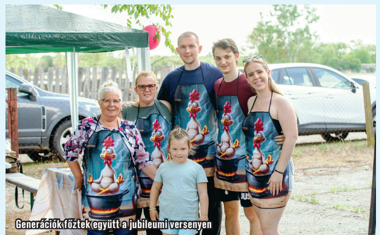
Generációk főztek együtt a jubileumi versenyen

A jókedvű eredményhirdetés során több különdíjat is kiosztottak. Díjazták többek között az összhangot, a generációk együttműködését, és a bogrács mestere címet is kiosztották. A szervezők