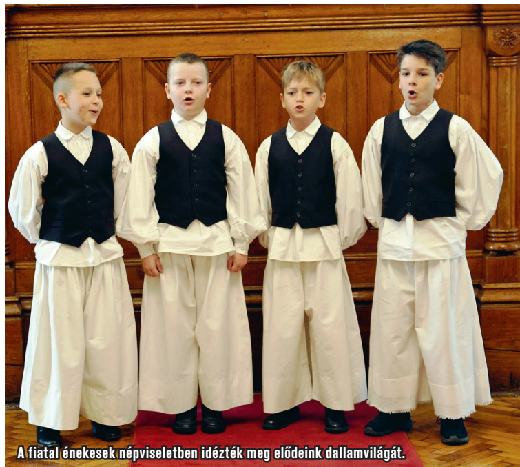
A fiatal énekesek népviseletben idézték meg elődeink dallamvilágát.

A versenyre 22 általános és középiskolából összesen 172 diák jelentkezett. A videós elődöntők után a legjobb 35 produkció kapott lehetőséget arra, hogy a döntőben, rangos szakmai zsűri előtt mutassa meg tudását. A zsűri elnöke Samu