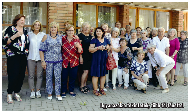
Ugyanazok a tekintetek, több történettel

Az este a vidámságról, a nosztalgiairól és a történetek megosztásáról szólt. Kisebb csoportokban