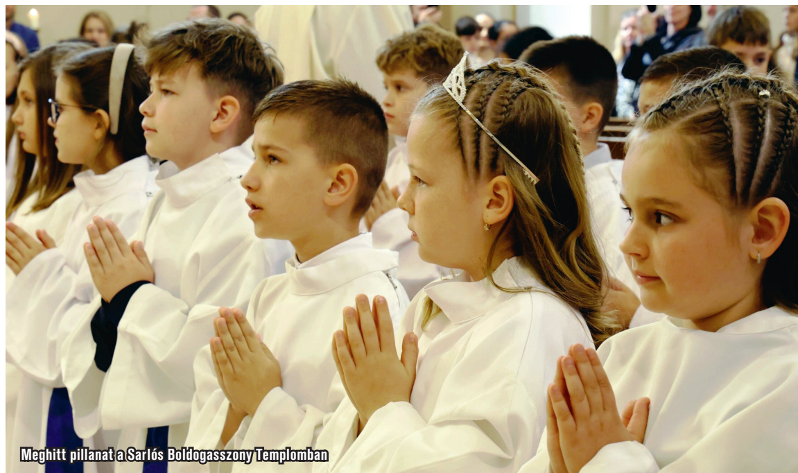
Meghitt pillanat a Sárló Boldogasszony Templomban

Az Úr imádsága után következett a szentáldozás meghitt pillanata. A gyermekek imára kulcsolt kézzel, csendben és elmélyülten járultak az oltárhoz, hogy első alkalommal vegyék magukhoz Krisztus testét és véréit.