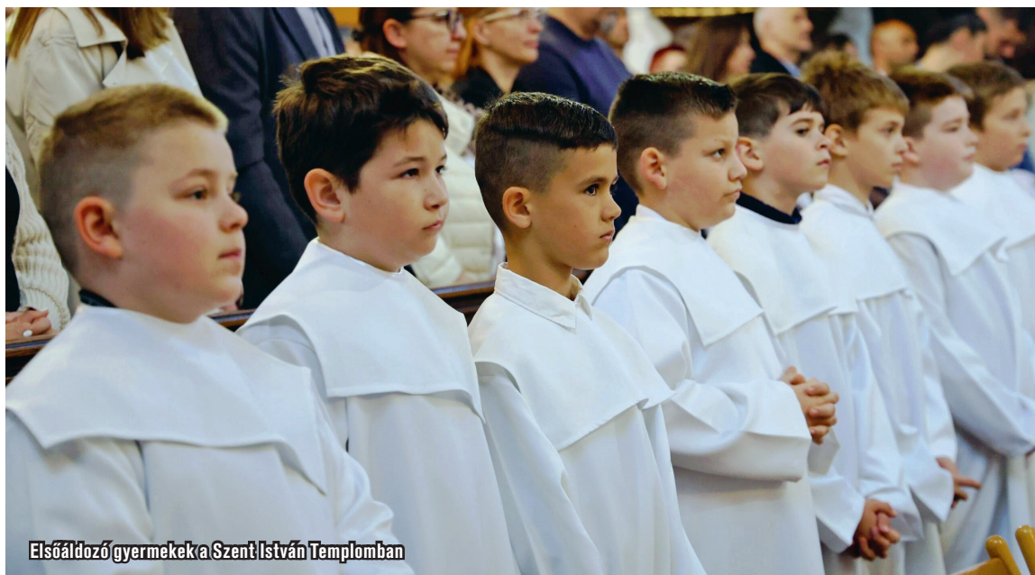
Elsőáldozógyermekek a Szent István Templomban

A Szent István Templomban május 3-án 24 fiú és 16 lány járult először szentáldozáshoz, nyilvánosan is megvallva hitüket és elköteleződésüket Isten mellett.