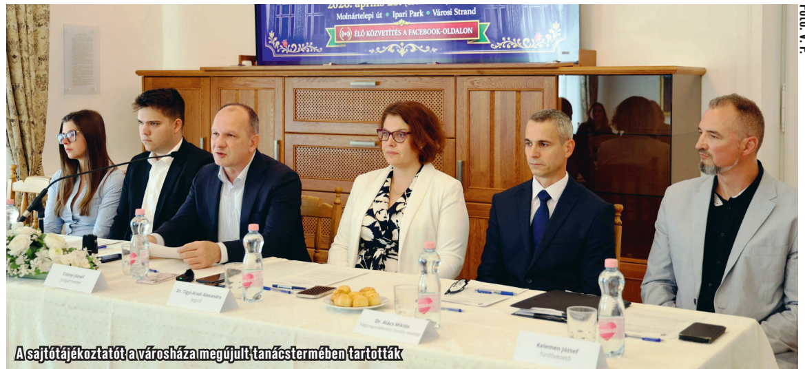
A sajtótájékoztatót a városháza megújult tanácstermében tartották

A kivitelezés előkészületei már megkezdődtek: zajlik a bozótirtás, a területrendezés, korábban pedig az ivóvízvezeték cseréje is megtörtént. A beruházás eredetileg 1,2 milliárd forintból valósult volna meg, azonban a pályázati feltételeknek nem tudott megfelelni a város, így végül saját forrásból, mintegy 700 millió forintból valósítják meg. Ennek fedezetét részben a Homokhátsági Regionális