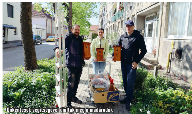
Önkéntesek segítségével újultak meg a madárodúk

A program során összesen nyolc új, B-típusú odút helyeztek ki, illetve cseréltek le. A korábbi odúk egy részét még a 2025-ben a könyvtár által szervezett ökotáborban részt vevő gyermekei készítették, és egy közös, őszi rendezvényen festették le őket. Azóta azonban több odú elhasználódott, így időszzerűvé vált a csere – tud-