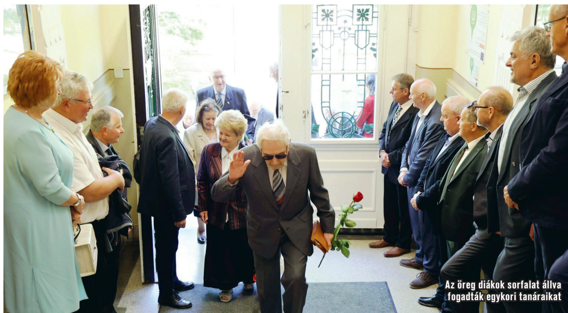
Az öreg diákok sorfállal állva fogadták egykori tanáraikat