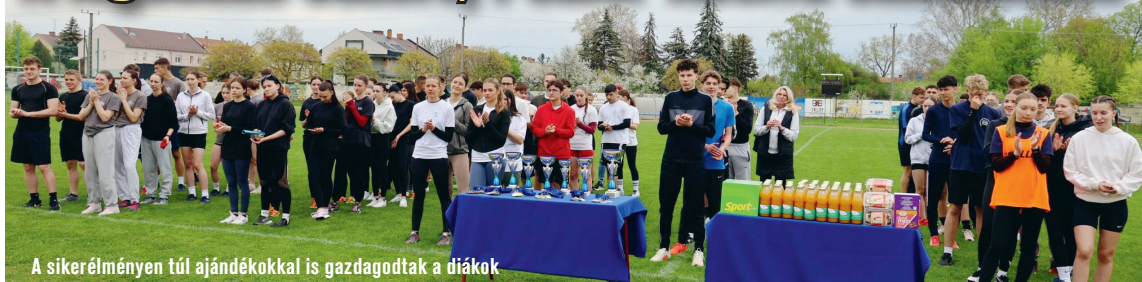
A sikerélményen túl ajándékokkal is gazdagodtak a diákok

Megtelt étellel, lendülettel és lelkesedéssel a Honvéd Sportpálya a közelmúltban: diákok, pedagógusok és vendégek együtt ünnepelték a mozgás örömét a Polner Tibor emlékére rendezett sportversenyen. Az esemény egyszerre adott teret a megmérettetésnek és a közösségi élménynek, miközben méltó módon idézte fel egy kivételes pedagógus szellemiségét.