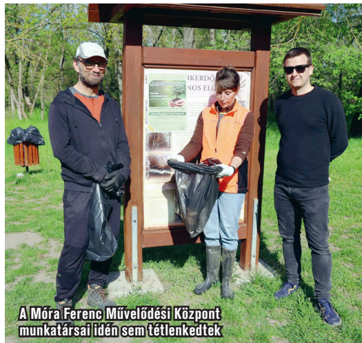
A Móra Ferenc Múvelődési Központ munkatársai idén sem tétlenkedtek

Ami azonban talán a leginkább dühítő, az az elemi higiénia és az embertársaink iránti tisztelet teljes hiánya. A beszámoló szerint