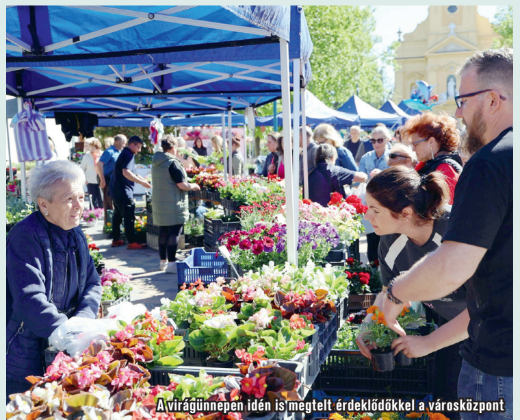
A virágünnepen idén is megtelt érdeklődőkkel a városközpont