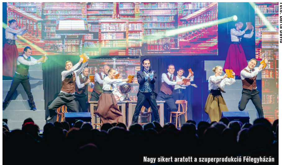
Nagy sikert aratott a szuperprodukción Félegyházán