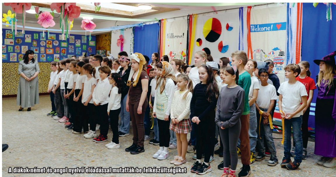
A diákok német és angol nyelvű előadással mutatták be felkészültségüket