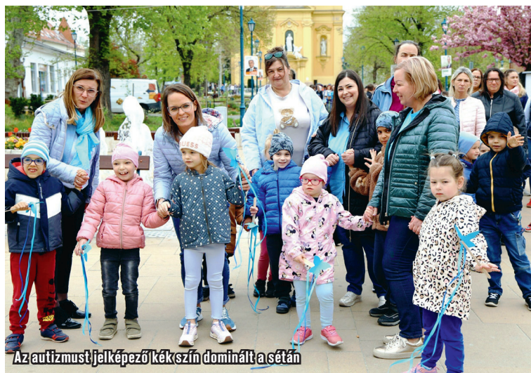
Az autizmust jelképező kék szín dominált a sétán

megmozdulásokkal és installációkkal hívják fel a figyelmet az autizmussal élő emberekre. Az autizmussal diagnosztizált gyerekek száma a KSH statisztikái szerint tíz év alatt megháromszorozódott. Az eduline.hu információi szerint az emelkedés oka az lehet, hogy a 90-es években egyáltalán nem diagnosztizálták az autistákat, vagy az értelmi fogyatékosok egy típusába sorolták őket. Nem véletlen, ugyanis az Autisták Országos Szövetségének leírása szerint ez az állapot rendkívül sokszínű, a „tünetek” pedig egyenként eltérnek, sőt, akár életszakaszonként