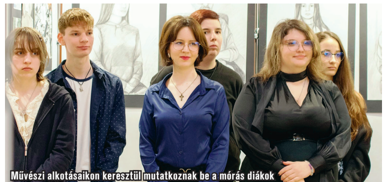
Művészeti alkotásaikon keresztül mutatkoznak be a mórás diákok

A kiállítás nemcsak a fiatal alkotók bemutatkozására adott lehetőséget, hanem arra is, hogy a látogatók közelebb kerüljenek a diákok