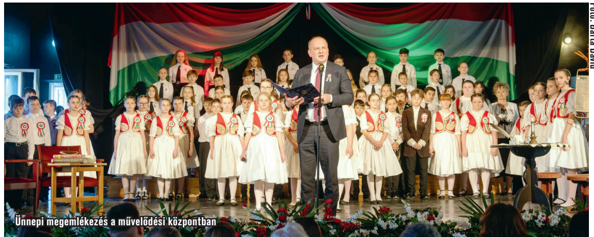
Ünnepi megemlékezés a művelődési központban

Ennek a történelmi pillanatnak az egyik legmeghatározóbb alakja Petőfi Sándor volt. Egy fiatal költő, aki nemcsak verseivel, hanem bátorságával és hitvallásával is példát adott a nemzetnek.