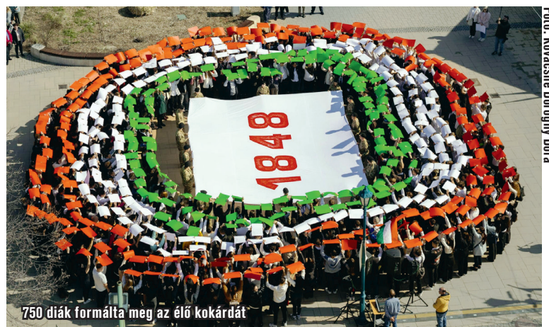
750 diák formálta meg az élő kokárdát

Az élő kokárda nemcsak látványos tisztelgés volt a márciusi