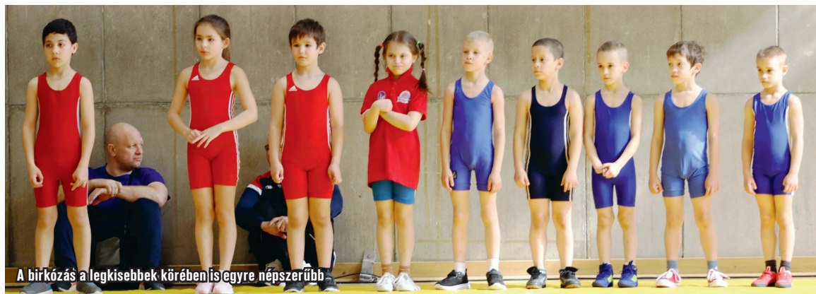
A birkózás a legkisebbek körében is egyre népszerűbb