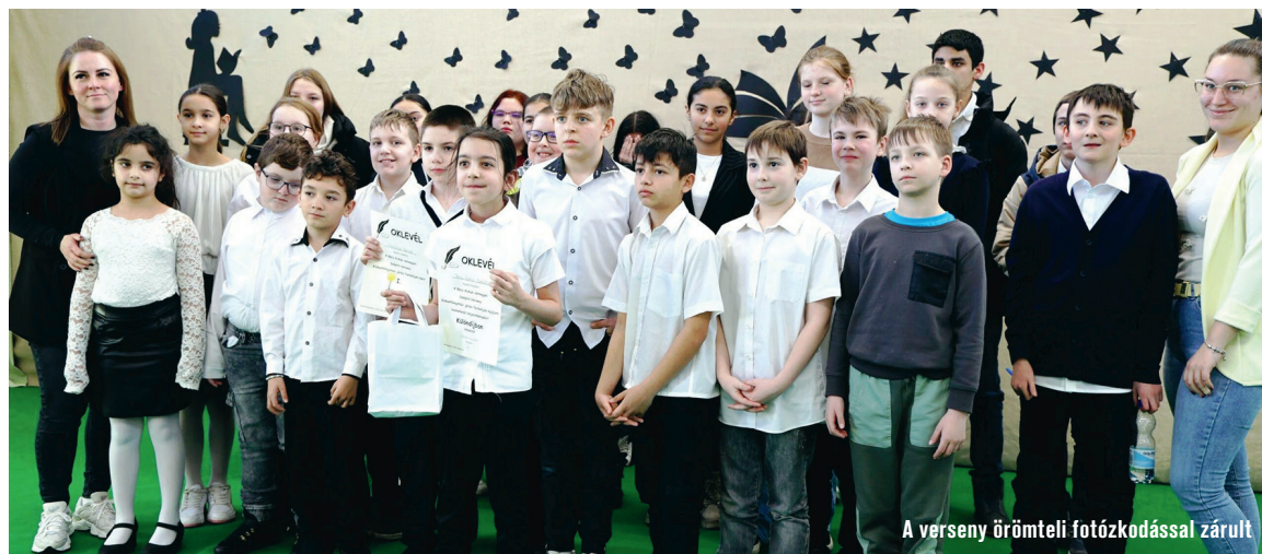
A verseny örömteli fotózkodással zárult

A megmérettetésen 11 iskola, több mint 100 tanulója vett részt, különböző korcsoportokban. Az eseményt Balla László alpolgármester nyitotta meg, aki beszédében a kézírás, a szépírás fontosságát hangsúlyozta, majd jó versenyzést kívánt a diákoknak. A vármegyei fordulóra továbbjutott tanulók április 13-án, Kiskőrösön mutathatják meg tudásukat. Az intézmény a közelmúltban több alkal-