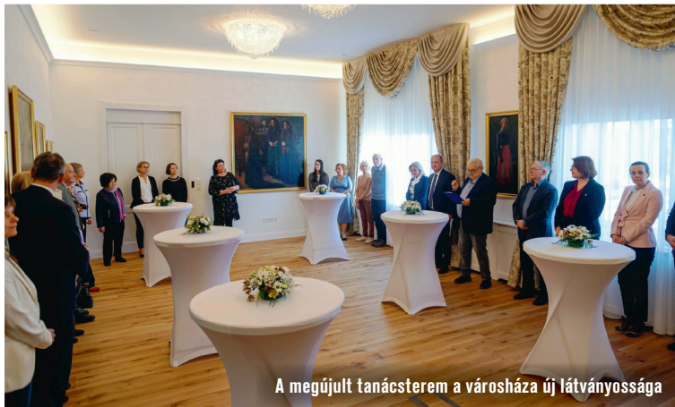
A megújult tanácsterem a városháza új látványossága

1914-től Debrecenben élt és alkotott. Festményein gyakran jelent meg az alföldi táj és az emberi sorsok küzdelme, erőteljes színekkel és drámai formavilággal. A két világháború közötti időszakban születtek jelentős művei, köztük a Szent István felajánlja a koronát Máriának és a Fehér ló áldozata.