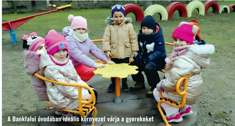
A Bankfalui óvodában ideális környezet várja a gyerekeket