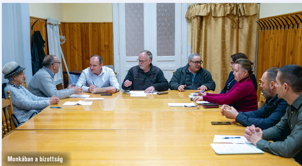
Munkában a bizottság