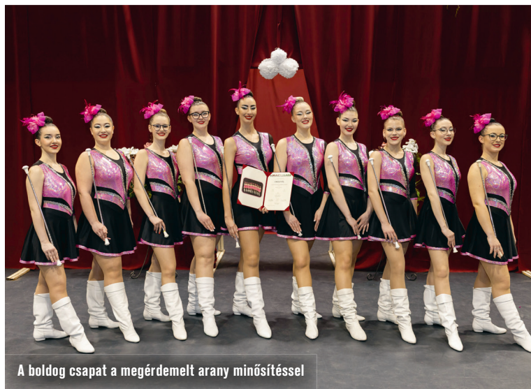
A boldog csapat a megérdemelt arany minősítéssel