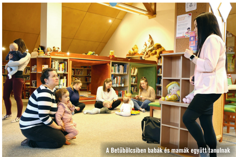
A Betűbölcsiben babák és mamák együtt tanulnak

hátrányait. Tájékoztatójában hangsúlyozta: a cél a stabil inzulinszint és az éhezés nélküli jó közérzet. Kitért arra, hogy a változtatásokat fokozatosan vezessük be a mindennapokba, így érhetünk el tartós, stabil eredményt. A megjelent édesanyáknak volt lehetőségük az előadás végén kérdéseket feltenni, amivel többen éltek is. Z. A.