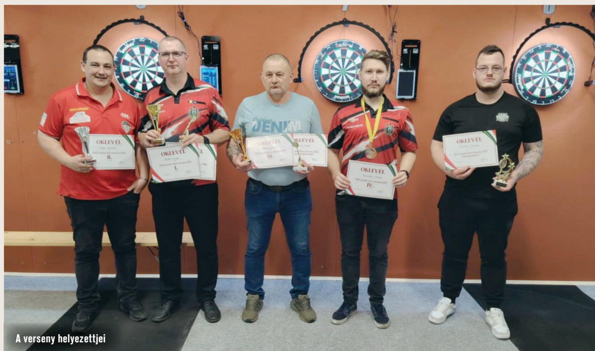
A verseny helyezettei

Valentin-napon sem maradtak tábla és nyilak nélkül a darts szerelmesei: február 14-én amatőr versenyt rendezett a Félegyházi Darts Sport Egyesület, amelyre több településről is érkeztek játékosok, hogy összemérjék tudásukat és egy sport-szerű, baráti hangulatú napon vegyenek részt.