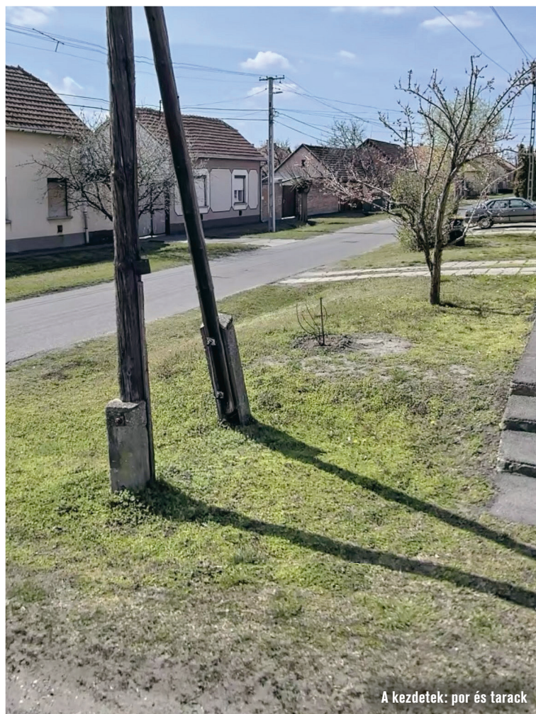
A kezdetek: por és tarack

A munkánk gyümölcse majd három-négy év múlva érik be igazán, de már annyi türelmet tanultunk és élményt kaptunk ettől a kertészről, ami felbecsülhetetlen egy kertbarátnak.