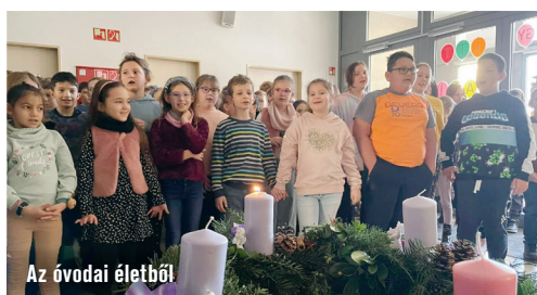
Az óvodai életből