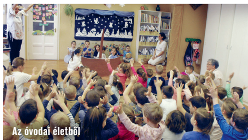
Az óvodai életből

Az alsó tagozatos osztályaink a mai kor elvárásainak megfelelően kialakított korszerű iskolaépületünkben kapnak helyet, mely saját tornateremmel, sportudvarral rendelkezik és közvetlenül szomszédos a sportcentrumunkkal és uszodánkkal is. Tanulóink a mindennapos testnevelés keretében úszás- és néptáncoktatásban is részt vesznek. Változatos lehetőségeket kínálunk a sportolásra (íjászat, zumba, Bozsik Intézményi Program, modern tánc) és a művészetekre (hangszer- és énektanulás) is a délutáni foglalkozások alkalmával. Tanulóink harmadik osztálytól kezdve órarendi keretben tanulhatnak idegen nyelvet, melyet az első és második évfolyamon választható idegen nyelvi szakköri foglalkozásokon tudnak megalapozni.