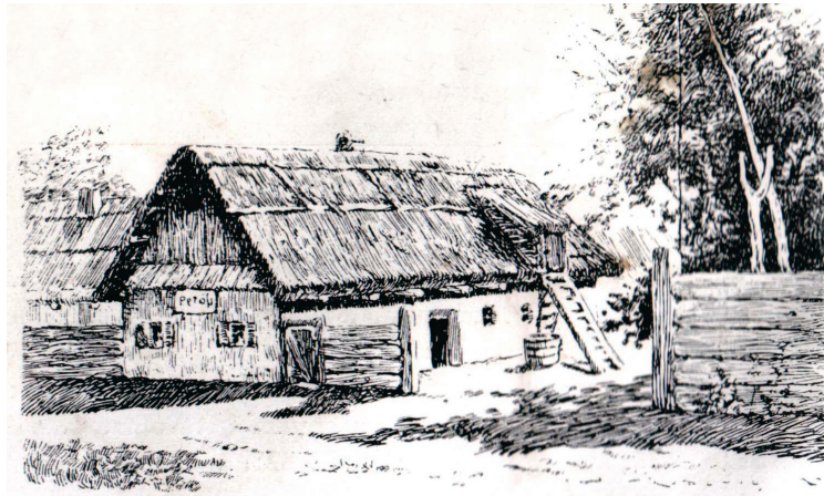
Petőfi szülőháza Kis-Kőrösön

Egy másik kiskőrösi népi elbeszélés arról szól, hogy a fiatal költő az utcán játszott, és addig kergette az árokszélen legelő libákat, amíg meg nem fogott egyet, majd kihúzta az állat farkából a legszebb tolat, és azt faragta ki írotollnak. A kiskőrösi Istenes Józsefné elbeszélése szerint (amely eset folklórként már inkább a helybeli tanítók között öröklődött vándoranekdota lehet) az éktelen gágogásra előjött a liba gazdája, aki meglátva a dolgot, elment Petőfi tanítójához, és beárulta neki, hogy mit művel a Petrovics-fiú. A történet konklúziója szerint a tanító nem verte meg a csínytevéséért Petőfit, mivel a