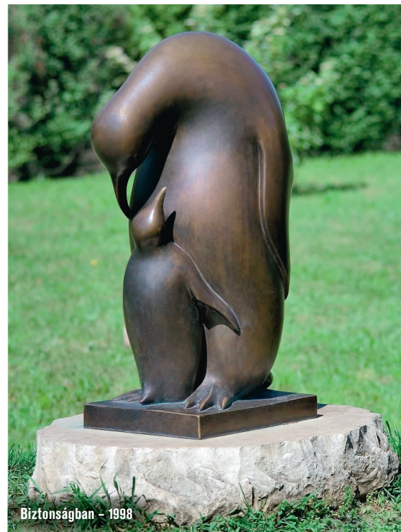
Biztonságban - 1998