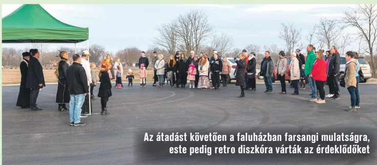
Az átadást követően a faluházban farsangi mulatságra, este pedig retro diszkóra várták az érdeklődőket