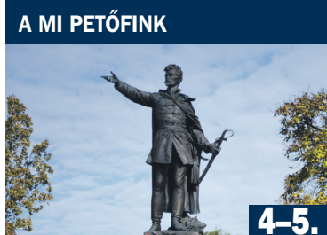
A MI PETŐFINK