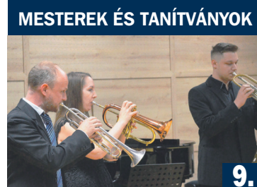
MESTEREK ÉS TANÍTVÁNYOK