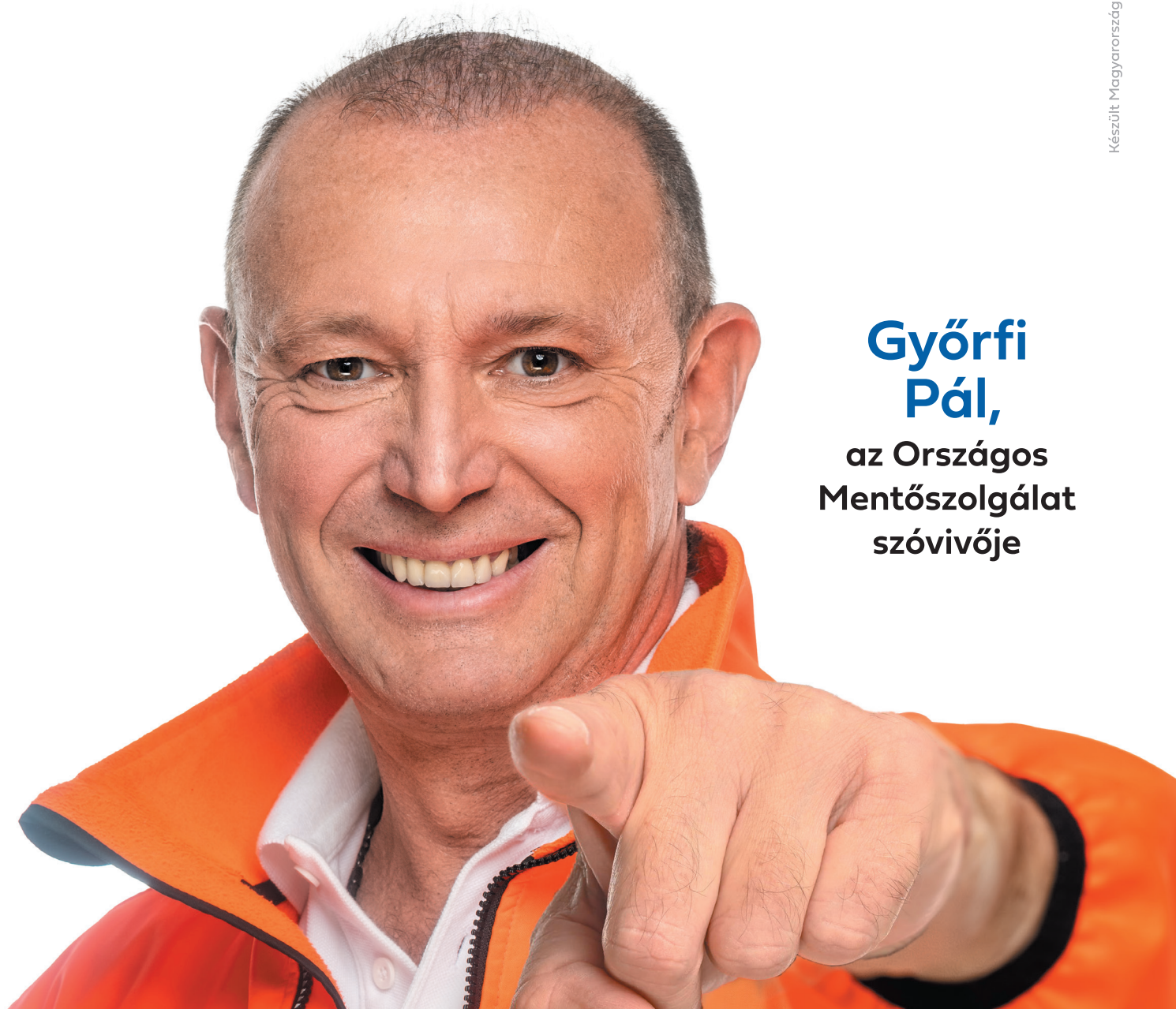
Győrfi Pál, az Országos Mentőszolgálat szóvivője

Készült Magyarország Kormányának megbízásából.