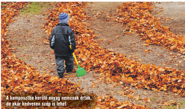
A komposztba kerülő anyag nemcsak érték, de akár kedvesen szép is lehet

tálás pedig pontosan ezeket tesszük. Ami a természetben évtizedek, évszázadok alatt zajlik le, azt mi néhány év alatt végezzük el kertünk erőforrásainak megújítása érdekében. Szuper értékes – az intenzív mező- és erdőgazdálkodás óta rohamosan pusztuló – humuszban gazdag „talajt” állítunk elő. És, hogy mi ebben a zseniálisan nagyszerű?