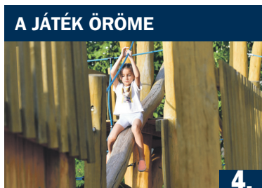
A JÁTÉK ÖRÖME