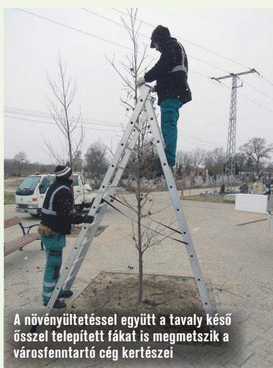
A növényültetéssel együtt a tavaly késő ősszel telepített fákat is megmetszik a városfenntartó cég kertészei

Első ütemben 2020-ban elkészült az út kanyargós nyomvonalával és mellette a ligetes fásítás, valamint a ravatalozó előtti térburkolatban kis növénykaszettákat készítettek, amelyekbe fákat telepítettek. A napokban pedig élő növényeket ültettek a fák köré, a fák alá pedig padokat helyeztek ki a városfenntartó cég munkatársai. Mivel a cég gondozza a város közparkjait is, a temetőben most ültetett növények a már beállt, elszaporodott, szétosztásra