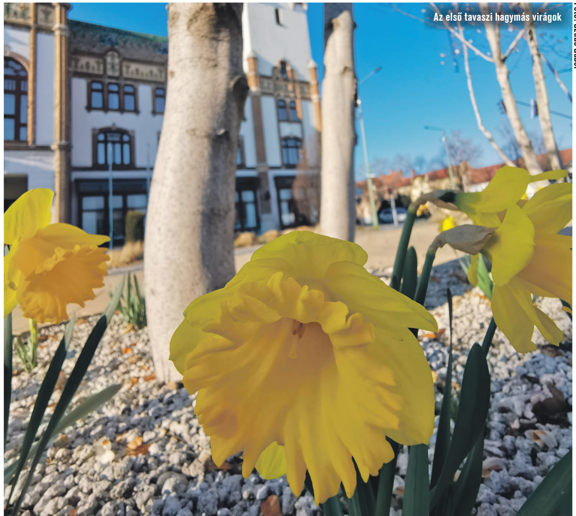
Az első tavaszi hagymás virágok

Csupán kis adalékként: tavaly az erősebb téli fagyok és a némiképpen egyenletesebb tavaszi felmelegedés miatt már március 18-án öntözni volt kénytelen a városfenntartó cég, idén erre várhatólag csak március végén kerül sor. Az öntözés beindítását követően rövid időn belül be kell állítani az összesen több, mint 200 önálló öntözött egységre osz-