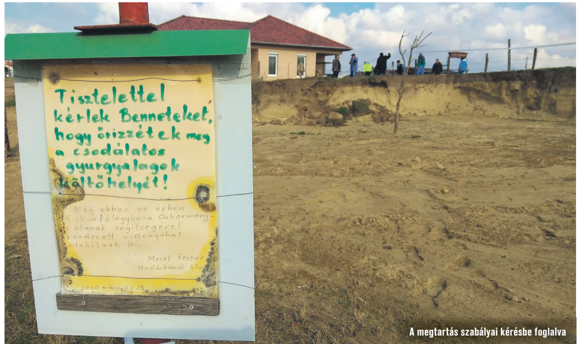
A megtartás szabályai kérésbe foglalva

– A települések növekedése gyakorlatilag mindig a természetes környezet felszámolásával jár együtt. Kedvező helyzetben azonban kisebb-nagyobb természetes terület tervezett módon kikerül, vagy körbenő a település. Félegyháza egy nagyon tipikus, ÉNY-DK irányban elhelyezkedő száraz buckák és nedves buckaközi mélyedések váltakozó finom domborzati rendjébe települt bele. Néhány vizes élőhely egy-egy darabja megmaradt a belterület határainál: az Alsótemető mögött, a Kálvária mellett vagy a Petőfi-lakótelep szélén, ugyanakkor az egykori homokdombok – miután a hosszú tájfejlődés során eleve a szél alakította, formálta őket – a megbolygatások nyomán többnyire elpusztultak. És pusztult velük a hozzájuk kötődő növény- és állatvilág is. A legújabb városrész, a Bankfalva is elért növekedése közben egy szélfúttá löszös-homokos természetes buckasort. Az egykori tanyavilág helyén, a szép alföldi