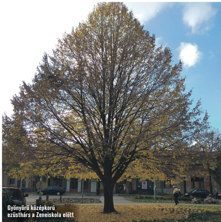
Gyönyörű középkorú ezüsthárs a Zeneiskola előtt

kori rossz faj- és fajtaválasztás hibáját azonban a legszakosított metszés sem javíthatja ki. Az ilyen fák későbbi helyben tartása nagy szakértelmet, sok időt és nem kevés pénzt igényel.