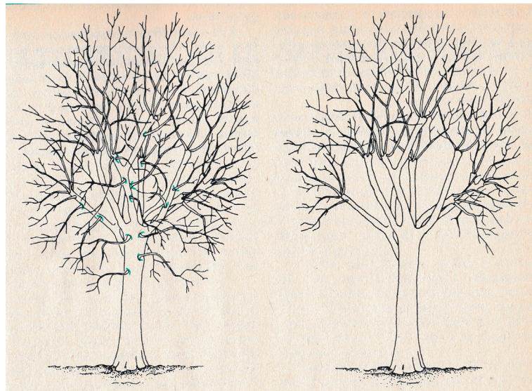
Faápolás a lombzat ritkításával: metszés előtt és után

Nem minden fa tűri a metszést. Vannak kitűnő regenerálódó képességgel bíró fajok (akác, zöld juhar), mások jól tűrik az ifjítást (hárs, platán, ostorfa), de pl. a gesztenyén, dión, kórisen ejtett seb kevésbé jól gyógyul. Erősebb ágak lemetésékor ügyelni kell rá, hogy a tartóágon a levágott ágból éppen csak annyi ferde metszlapú csonkot hagyjunk, hogy annak szélein a seb lezárását biztosító hegyszövet növekedésnek indulhasson. A metszés nélkül is szépen fejlődő fákat – mint pl. a liliumfa, a nyír, a gyertyán, tölgy, bükk – nem metszünk, a visszavágással hiányos lesz a koronájuk. Az ültetés-