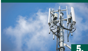
NEM ÉPÜLHET TORONY