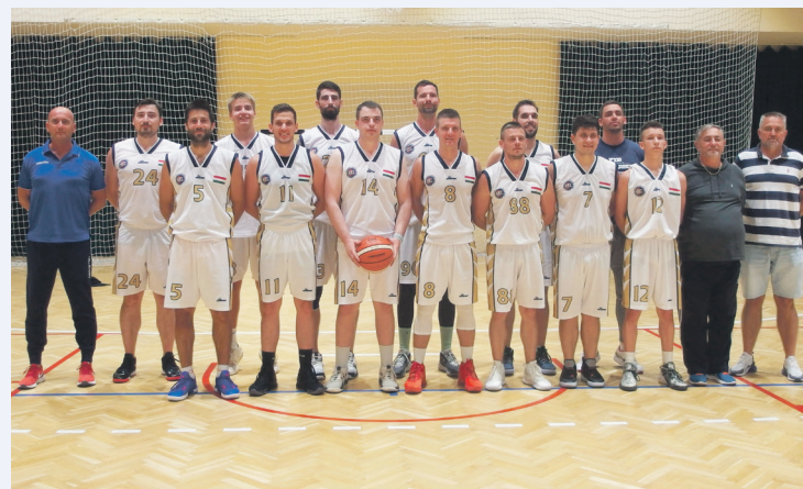
Sportszerkesztő: Gubu Zoltán

Kiskunfélegyházi KC – Gyulai Color 109-76 (28-10, 24-20, 32-26, 25-20)