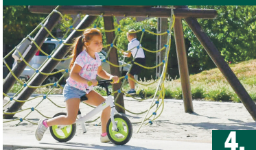
PARK ÉS JÁTSZÓTÉR

XXIX. évfolyam 13. szám 2020. szeptember 25. MEGJELENIK KÉTHETENTE