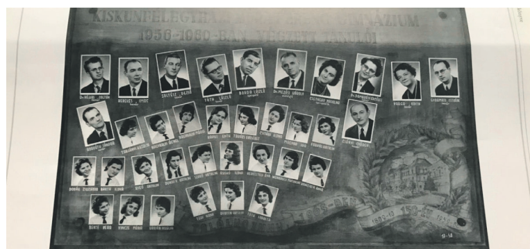
1959/60. tanév, IV. B