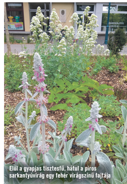
Elöl a gyapjas tisztessű, háttul a piros sarkantyúvirág egy fehér virágszínű fajtája