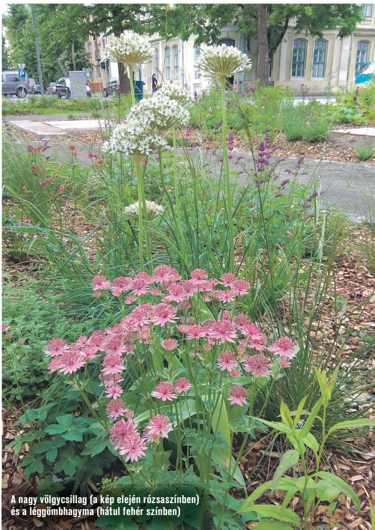
A nagy völgycsillag (a kép elején rózsaszínben) és a léggömbhagyma (háttul fehér színben)

Méhbalzsam , ápolka, indiáncsalán. A sokféle néven ismert növény Észak-Amerikából származik, hazánkban leginkább a tűzpiros színű változata ismert. A Félegyházára ültetett faj késő tavasszal virágzik halványlila színben, rendkívül lát-