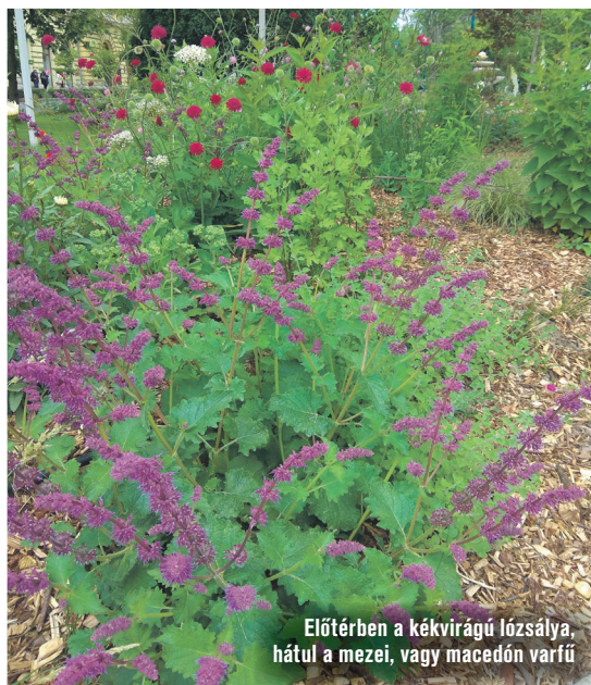
Előtérben a kékvirágú lózsálya, háttul a mezei, vagy macedón varfű