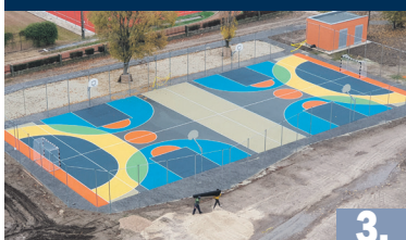
ÉPÜL A SPORTPÁLYA

XXVIII. évfolyam 20. szám 2019. november 22. MEGJELENIK KÉTHETENTE