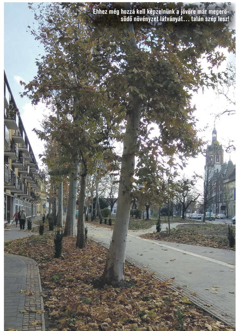
Ehhez még hozzá kell képzelnünk a jövőre már megerősödő növényzet látványát... talán szép lesz!