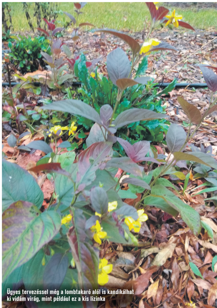
Ügyes tervezéssel még a lombtakaró alól is kandikálhat ki vidám virág, mint például ez a kis lizinka