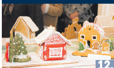
MESEVÁROS IDÉN IS