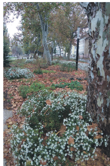
A platánfák alatti, természetközeli módon kialakított növénygy novemberi dísz a késői virágzású őszirozsa, jól látható, hogy itt már nem idegen az évelő növények téli védelmét, a talaj takarását és tápanyag visszajuttatását biztosító őszi lombhullásból származó mulcs, bájos képet nyújtva az arra sétálóknak