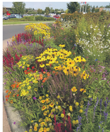
Egynyári virággy rövid ideig pompázó, de akkor nagyon intenzív dísz adó növényekből, a magas egynyári virágok jól egészítik ki az évszakos váltást mutató évelő növényeket