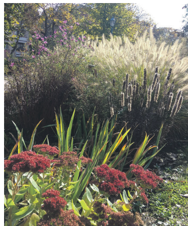
A Móra-téren mintegy 15 évvel ezelőtt, nagyrészt stressztűrő növényekből telepített virággy, láthatóan most már rájuk fér a szétültetés