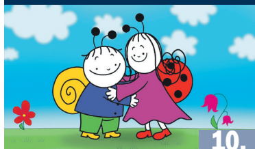
BOGYÓ ÉS BABÓCA KLUB