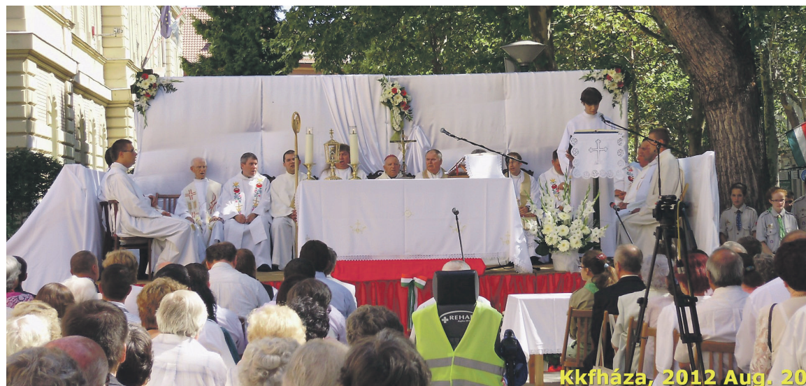
Kkfháza, 2012 Aug. 20