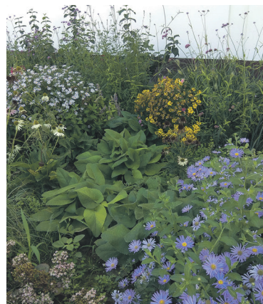
Az előző virággy augusztus-szeptemberben, jól látható, az erős telepeket képző növények társasága szép együttest alkot