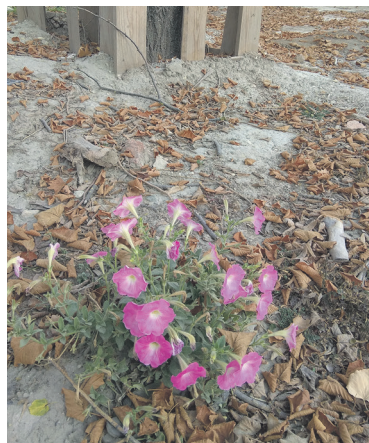
Az élet csodája: vadon kelt egynyári, úgynevezett parasztpetúnia a fűtéri építési munkák területén