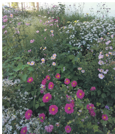
Ugyanaz a virággy októberre már jól záródott állományt képez, megfigyelhető hogyan váltják egymást a nyári és őszi virágzású évelők