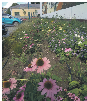
Tavaly októberben túlnyomóan kompetitor növényekből telepített városközponti virággy, június-júliusban