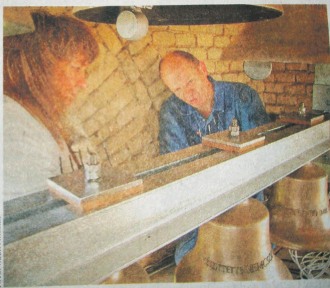
Száz dallam lejátszására programozható

Hamarosan megszólal a harangjáték, hiszen szerdán végleges helyükre, a kiskunfélegyházi Újtemplom (szemből nézve) bal oldali tornyába kerültek azok a harangok, amelyek a templom búcsúján, Szent István napján szólnak meg először. A tizenkét harangból álló „hangszer” Passauban készült a világhírű Perner-harangöntőben. Kiskunfélegyháza első harangjátéka az egyházközség tagjainak adományából valósulhatott meg. A harangjátékot – amely több mint száz dal eljátszására is beprogramozható – pénteken üzemelik és hangolják be a szakemberek.