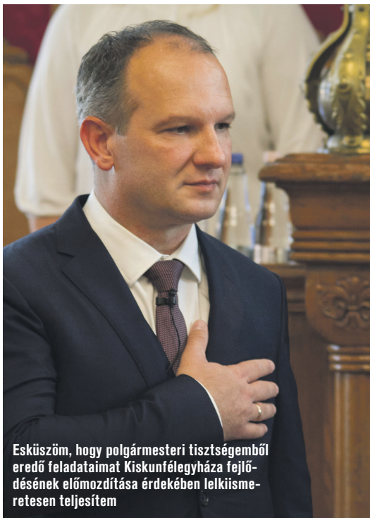
Esküszöm, hogy polgármesteri tisztségéből eredő feladataimat Kiskunfélegyháza fejlődésének előmozdítása érdekében lelkiismeretesen teljesítem

adatunk, hogy városunkat tovább fejlesszük, építsük, pótoljuk azokat a hiányosságokat, melyek a városi lét alapjait képezik. Továbbra sem kívánunk kicsinyes, másokat lejárató politikai játszmákat folytatni, nem kívánjuk városunkat az országos politika hadszínterévé változtatni és nem tartjuk feladatunknak az ellenfeleink minősítését sem. Úgy gondolom, ez a szavazópolgárok feladata, akik szavazataikkal október 13-án el is mondták véleményüket.