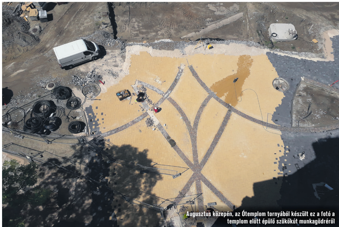
Augusztus közepén, az Ótemplom tornyából készült ez a fotó a templom előtt épülő szökőkút munkagödöréről

Lassan kezd kibontakozni a Zöld város beruházás végeredménye. S bár nagyon sok munka van még hátra, a Szent János tér, a templomkert és a Petőfi tér környékén már sejteni lehet a végleges felületeket.