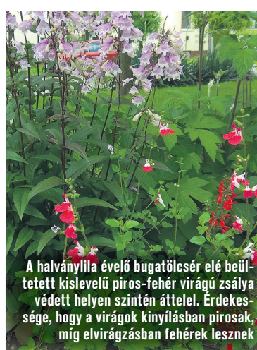
A halványlila évelő bugatölcsér elé beültetett kislevelű piros-fehér virágú zsálya védett helyen szintén áttelel. Érdekesége, hogy a virágok kinyílásban pirosak, míg elvirágzásban fehérek lesznek

A folyamatos változás, fejlődés jegyében a parkfenntartásban is állandó fejlesztések szükségesek: a mind gyakoribb szélsőségesen meleg, száraz nyarak – sőt ősök –, valamint az egyre inkább jelentkező munkaerőhiány technikai fejlesztéseket sürget. A virágágyakban is meg kell oldanunk a kézi öntözés kiváltására szolgáló öntözőrendszerek kialakítását: jelenleg egyre több helyen törekszünk csepegtető rendszer kiépítésére. Ez persze vissza fog hatni a virágágyak kialakításának módjára is, mivel a tavaszi és az őszi virágültetés – talajelőkészítés, majd az ültetés – miatt az öntözőcsöveket mozgatni kell. Az egyes elemek egymásra hatásának vizsgálatában, tanulmányozásában, tapasztalatok gyűjtésében és kiértékelésében mi magunk is állandó tanulásban vagyunk.