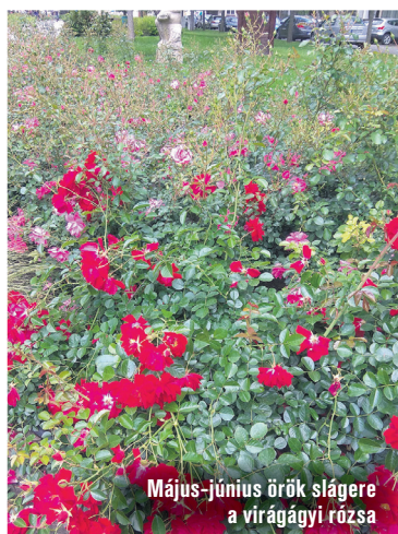
Május-június örök slágere a virágágyi róza