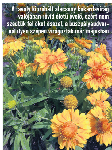
A tavaly kipróbált alacsony kokárdavirág valójában rövid életű évelő, ezért nem szedték fel őket ősszel, a buszpályaudvarnál ilyen szépen virágoztak már májusban

A nyári virágok kiültetését május közepén szoktuk kezdeni, és általában június elején fejeződik be. Tavaly a nyár eleje hűvös, csapadékos volt, emiatt a nagyon melegigényes vinca megfázott és nagyobb része az ültetést követően megcsúnyult, elpusztult.