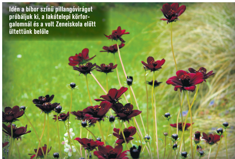
Idén a bíbor színű pillangóvirágot próbáljuk ki, a lakótelepi körforgalomnál és a volt Zeneiskola előtt ültettünk belőle