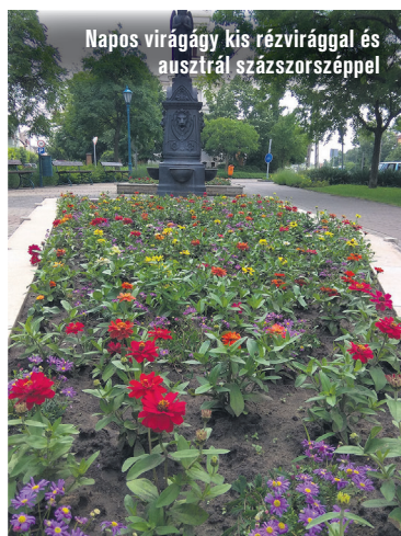
Napos virágágy kis rézvirággal és ausztrál százszorszéppel