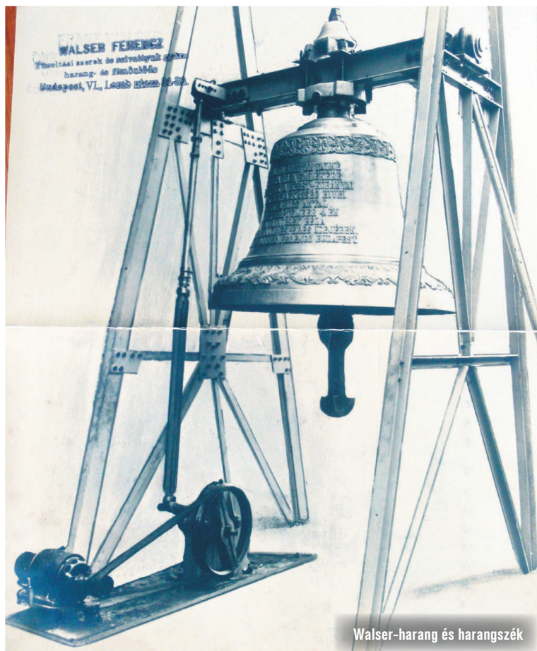
Walszer-harang és harangszék

Az előző részekben megismerhettük azokat a félegyházi embereket, akik kezétől a harangok 276 éve szólnak. A sorozatot folytatva, a továbbiak arról mesélnek, honnan és milyen mesterektől kerültek ide harangok. Kik (voltak) ők, akik idejük, tehetségük és lelkük egy részét a félegyháziaknak áldozták?