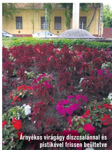
Árnyékos virágágy díszcsalánna és pistikével frissen beültetve