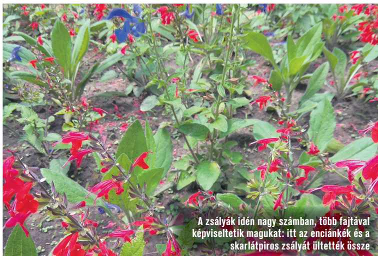
A zsályák idén nagy számban, több fajtával képviseltetik magukat: itt az enciánkék és a skarlátpiros zsályát ültették össze