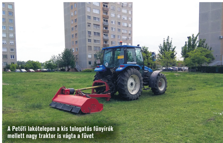
A Petőfi lakótelepen a kis tologató fűnyírók mellett nagy traktor is vágta a fűvet