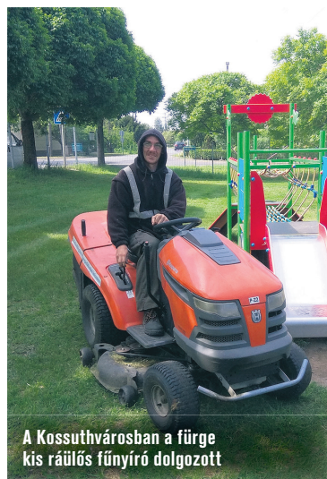
A Kossuthvárosban a fűre kis ráúlös fűnyíró dolgozott

töve lassacskán kikopik, megmélyül, ide új kísérletként a levágott fűnyesedéket terítjük vissza 8-15 cm vastagon. Ez a helyben keletkező olcsó mulcsanyag – terveink szerint – megakadályozza a gyomosodást, néhány hónap alatt bekomposztálódik, ezzel visszatölti a kikopott talajt és egyben nem kell elszállítani a szerves zöldhulladékot, az a zöldfelületet talaját fogja javítani. Egyelőre a volt Zeneiskola előtti parkban kezdtük el.