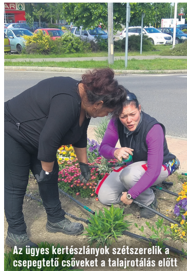
Az ügyes kertészlányok szétszerelik a csepegtető csöveket a talajrotálás előtt