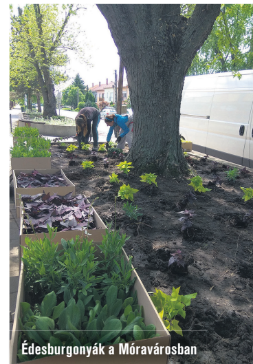
Édesburgonyák a Móravárosban