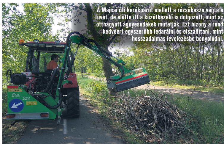
A Majsai úti kerékpárút mellett a rézsúkasza vágta a fűvet, de előtte itt a közútkezelő is dolgozott, mint az otthagytott ágnyesedékek mutatják. Ezt bizony a rend kedvéért egyszerűbb ledarálni és elszállítani, mint hosszadalmas levelezésbe bonyolódni.