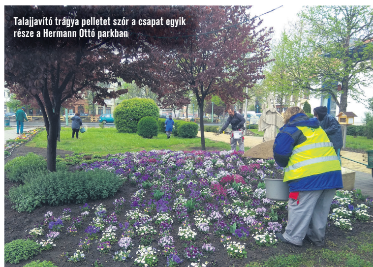
Talajjavító trágya pelletet szór a csapat egyik része a Hermann Ottó parkban