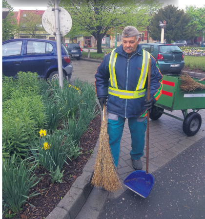
A zöld- és járdafelületek tisztántartása is hozzátartozik a parkok gondozottságához

Jó látni, amikor a jól végzett munka – bizony fáradságos – örömeivel a kertészek maguk is megállnak egy pillanatra megnézni az eredményt, de tudjuk, hogy ez a munka Önökért, Önöknek van. És nagyon jó, amikor azt tapasztaljuk, hogy az itt élők is ráhangolódnak erre a városi dalárdára, és szépülnek az előkertek, kertek, ház előtti utcaszakaszok, egyre szebb és szebb dallamok csendülnek ásóval, kapával, gereblyével.