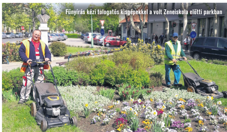
Fűnyírási kézi tologatós kisgépekkel a volt Zeneiskola előtti parkban

ket, vagy halljuk a fűnyíró, gyepszellőztető, gyepszelvágó gép és a motoros fűrész berregését, de illatozhatjuk a frissen szétszórt talajjavító trágya pellet természetesen egészséges illatát is.