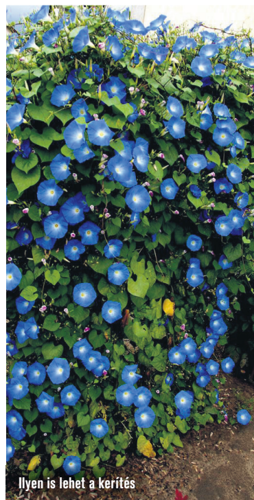
Ilyen is lehet a kerrítés

Nincs recept rá, hogy milyen méretű, kinézetű, használatú ez a hely. Tulajdonképpen ilyen szemszögből nézve nem is összehasonlíthatók, sokkal inkább egymást kiegészítők. Együtt valami titokzatos módon városképet