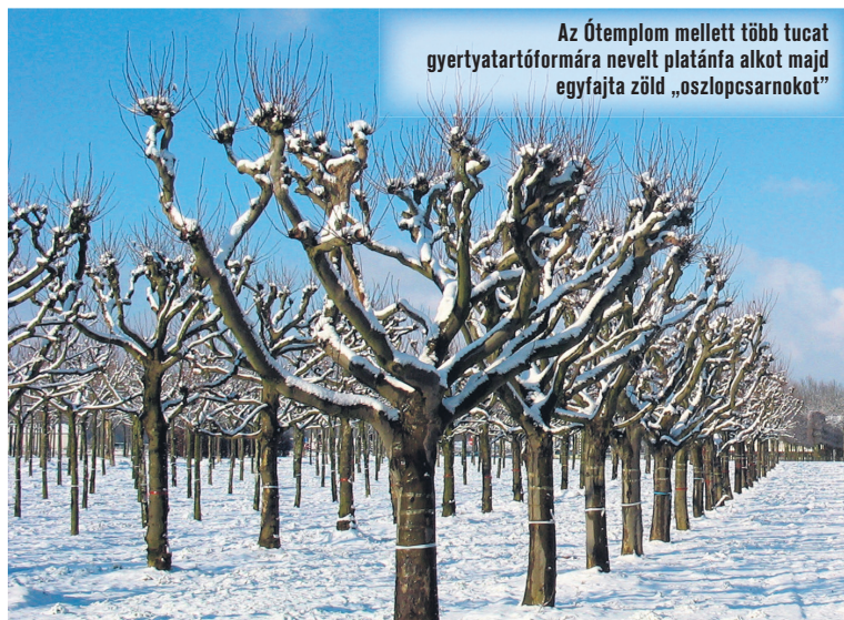
Az Ótemplom mellett több tucat gyertyatartóformára nevelt platánfa alkot majd egyfajta zöld „oszlopcsarnokot”

utca első szakaszán – ahol most kísérleti jelleggel kivágják a platánokat – előnevelt, fehértörzsű platánokkal pótoljuk. A templom mögé kerül egy öt-hat méteres érkező aranyalmafa, a történelmi időkből az oltár mögötti részen elhelyezett paradicsomi kert hagyományára visszautalva, és az emberi természet romlatlanságába vetett hitet erősítve. Figyelmet fordítottunk arra, hogy mindenható vállalkozó méretű, faként észlelhető darabokat ültessünk, hogy ezzel is próbáljunk visszaadni valamit abból, amit a fakivágás kénytelen-kelletlen elvett. Erről azonban csak jövő ilyenkor tudnak meggyőződni a félegyháziak. Addig is számíthatunk a türelmükre és megértésükre.