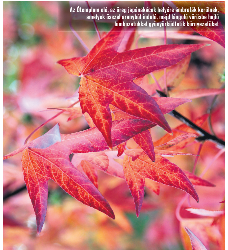
Az Ótemplom elé, az öreg japánakácok helyére ámbrafák kerülnek, amelyek ősszel aranyból induló, majd lángoló vörösbe hajló lombzatukkal gyönyörködtetik környezetüket

– A kivágott és elköltöztetett fák helyén legfeljebb egy-egy földkupac marad, a kezelt fákon ilyen-olyan visszavágások nyomai lesznek. A legszembeütőbb a főtéren, ezen belül is az Ótemplom környékén lesz a változás. A templom előtt eltűnnek az öreg japánakácok, a templom mellől pedig a vadkörtefa-sor. Több helyen a nem odavaló, beteg fák kivágása történik meg, a Kossuth utca 5-ös úttól Mártírok utcáig terjedő szakaszán mindkét oldalon összefüggően, több helyen pedig pontszerűen lesznek kivágva