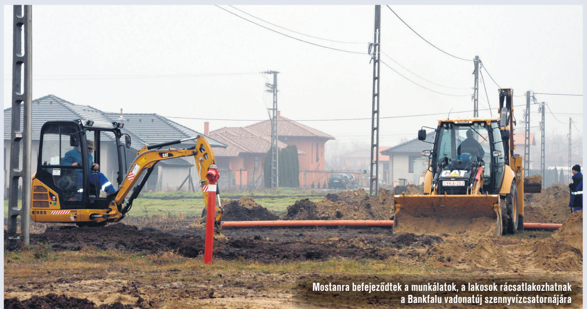
Mostanra befejeződtek a munkálatok, a lakosok rácsatlakozhatnak a Bankfalu vadomatúj szennyvízcsatornájára