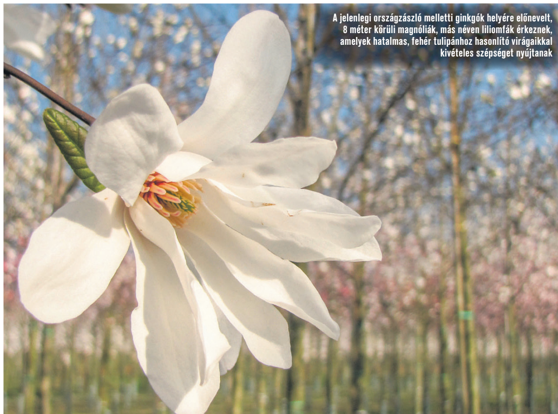
A jelenlegi országzászló melletti ginkgók helyére előnevelt, 8 méter körüli magnóliák, más néven liliumfák érkeznek, amelyek hatalmas, fehér tulipánhoz hasonló virágaikkal kivételes szépséget nyújtanak

– A közműves munkálatok a fakivágásokkal egyidőben már megkezdődnek. Az áramszolgáltató szép gesztusa a város felé,