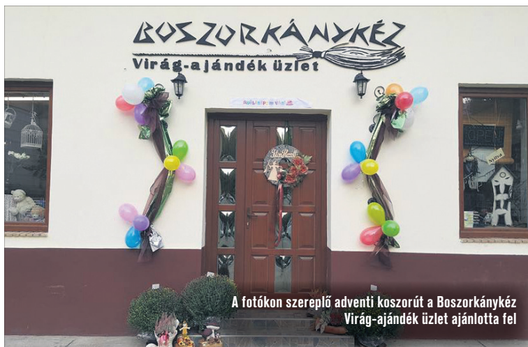
A fotókon szereplő adventi koszorút a Boszorkánykéz Virág-ajándék üzlet ajánlotta fel