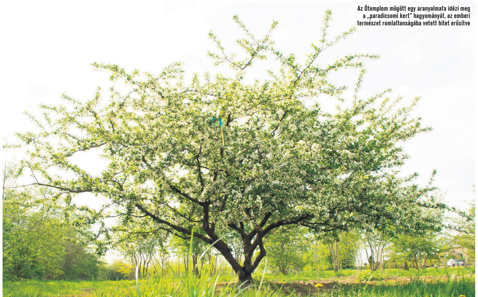
Az Ótemplom mögött egy aranyalmafa idézi meg a „paradicsomi kert” hagyományát, az emberi természet romlatlanságába vetett hitet erősítve