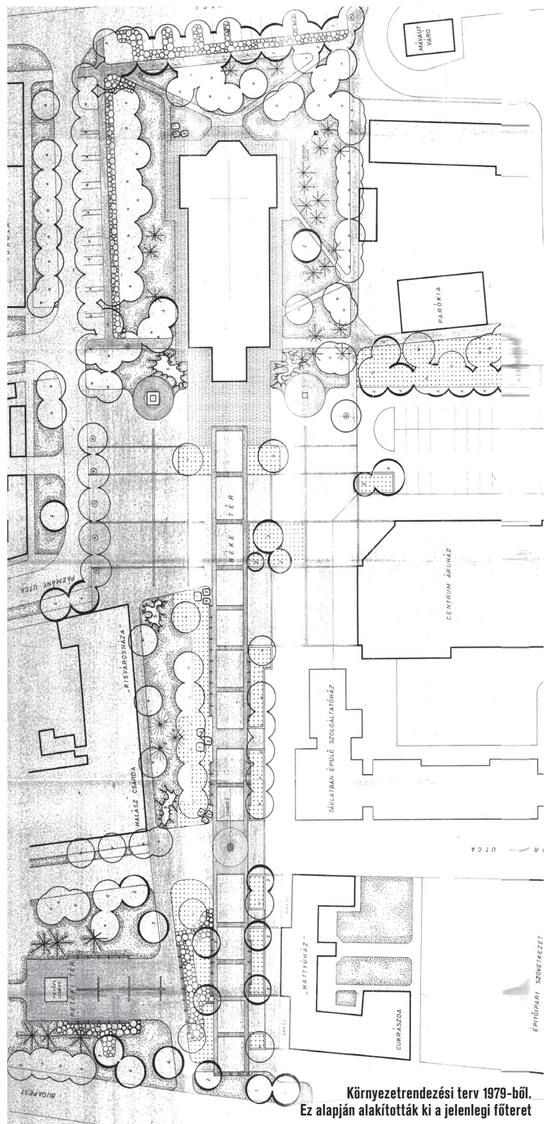
Környezetrendezési terv 1979-ből. Ez alapján alakították ki a jelenlegi főtérrel

get” közé terelve egy városi sétátér mutatja meg magát. A kiemelt növényágak szélén ülőpadsor jelzi, hogy itt meg lehet-kell állni, leülni várakozni, beszélgetni, nézelődni. Ez a tér igyekszik nagyon nyitott lenni a szomszédos üzletek felé.