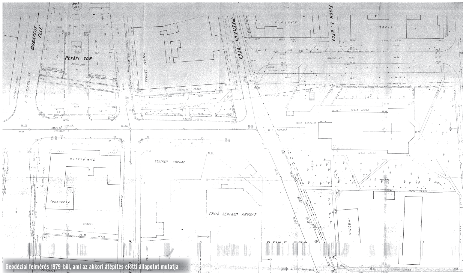
Geodéziai felmérés 1979-ből, ami az akkori átépítés előtti állapotot mutatja

előtti fogadótérhez kapcsolódik az a reprezentatív rendezvényter, amely a piac bejárata előtt, nagyjából a tér közepén, térfalak által legkevésbé behatároltan ad helyet a városi rendezvényeknek, koncerteknek, de az „álmos hétköznapok” nyüzsgő forgatagát is ez a tér fogadja majd be, átvezetve az autóbussz-pályaudvarhoz és a faliképes parkolóhoz és aztán tovább a Móra térre. Az ide tervezett mozgózives, kaszkádós vízarchitektúra-látványosság és egyben nyári közérzetjavító köztéri elem. A gyalogosokat a Hattyúház előtti sok kis „zöld szí-