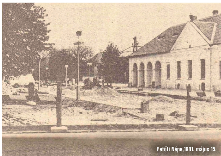
Petőfi Népe, 1981. május 15.

És a címbeli kérdésre most már 2018-ban válaszolva: közösségi tér épül a főtéren. Ezt a tervet a Pagony Táj- és Kertépítész Iroda