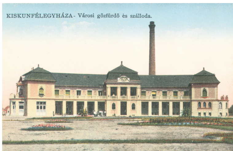
KISKUNFÉLEGYHÁZA - Városi gőzfürdő és szálloda.

Végül a második változat nyert, 1926 és 1928 között felépült a Fürdőszálló impozáns, erkélyes, ívelt épülete Hegedűs Ármin és Böhm