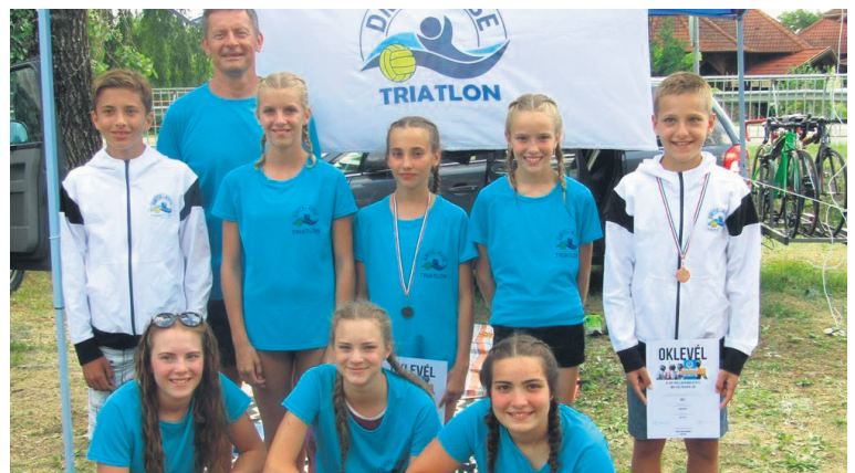
Sportszerkesztő: Gubu Zoltán

el a tanulókat, akiket az egyesület látott vendégül. A legjobbakat kupákkal, érmeikkel, illetve horgászati eszközökkel jutalmazták – mondta el Forgó István egyesületi elnök. Az általános iskolák között a darvasos tanulók győztek, mögöttük a dózsások, illetve a platánosok végeztek. A középiskoláknál az első helyet a Meződiákjai szereztek meg, másodikként a Közgé, míg harmadikként a Szent Benedek iskola tanulói zártak.