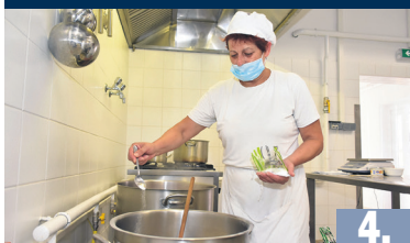
A VÁROS KONYHÁJA

XXVII. évfolyam 12. szám 2018. július 3. MEGJELENIK KÉTHETENTE