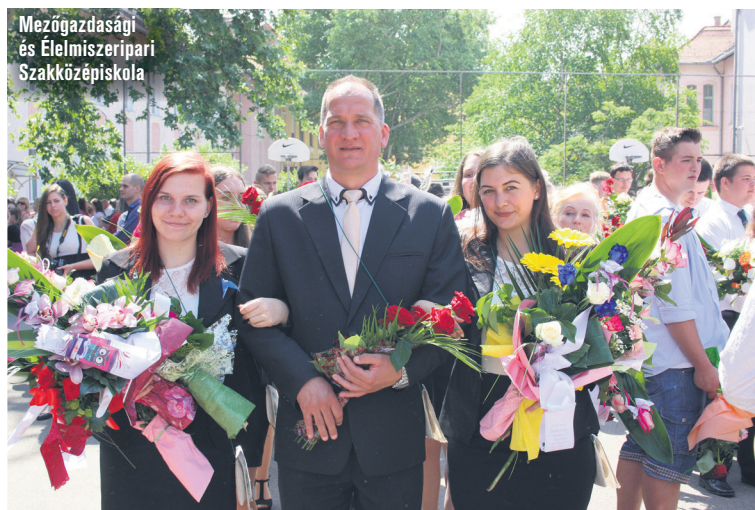
Mezőgazdasági és Élelmiszeripari Szakközépiskola