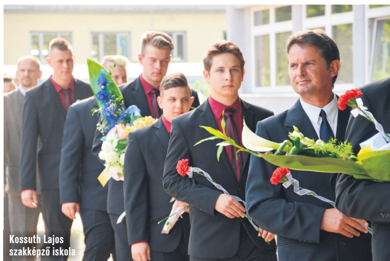
Kossuth Lajos szakképző iskola