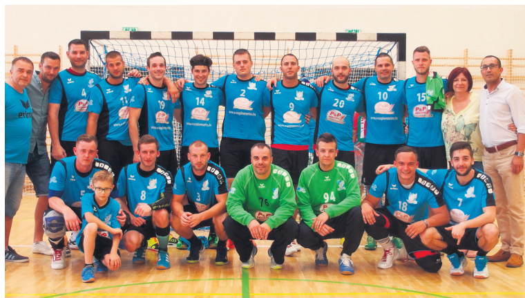
Sportszerkesztő: Gubu Zoltán

P&P Kiskunfélegyházi HTK – Békéscsabai BDSK 32-27 (17-15)