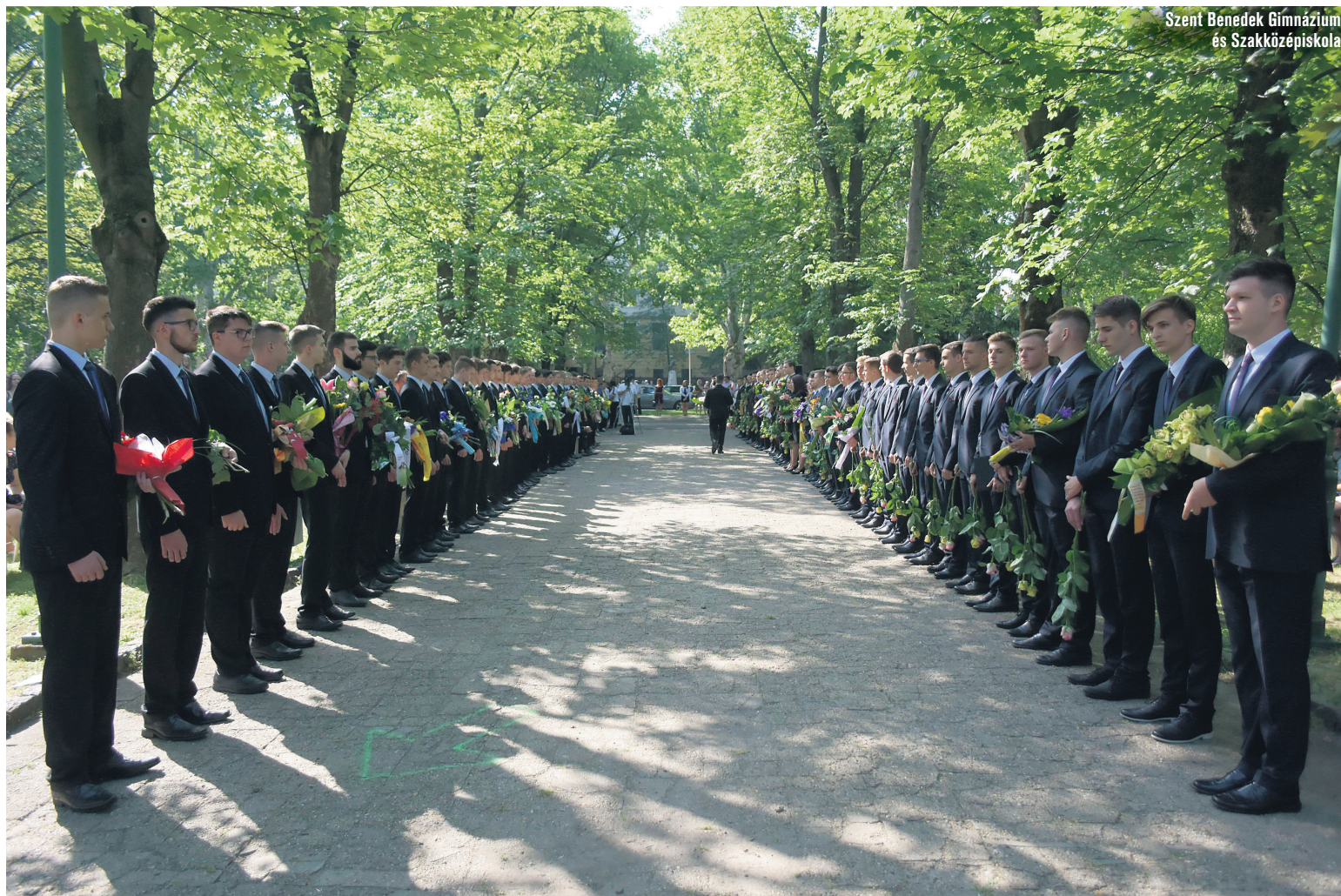
Szent Benedek Gimnázium és Szakközépiskola