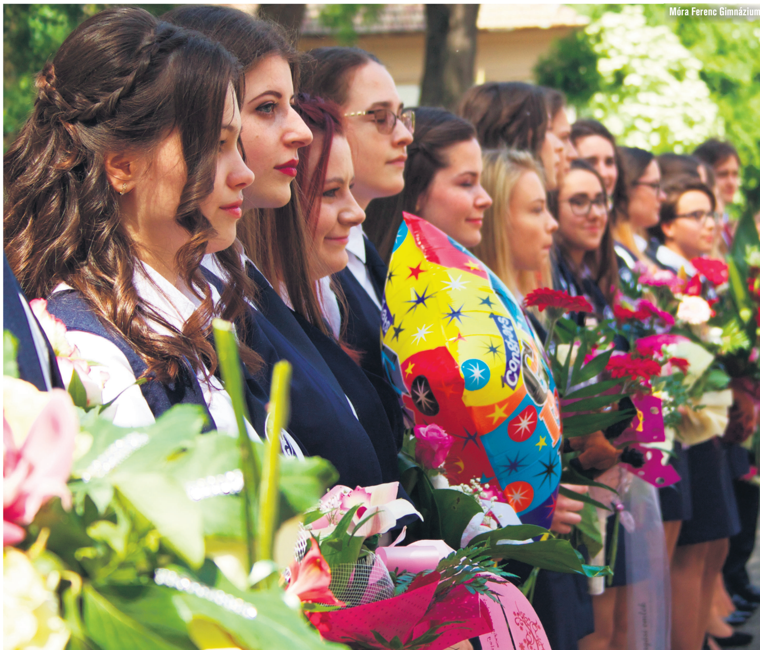
Móra Ferenc Gimnázium