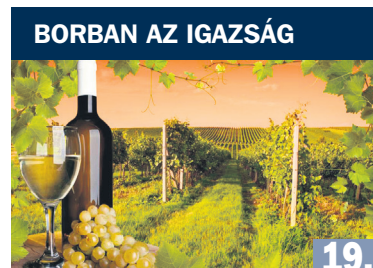
BORBAN AZ IGAZSÁG