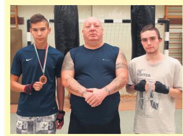
Sportszerkesztő: Gubu Zoltán

Gólszerzők: Gál Bianka 5. p., Tillinger Dóra 24. p., Zemlényi Csenge 40. p., ill. Mészáros Dalma 20. p., 21. p., 36. p. (büntetőből), Balázs Eszter 21. p., 31. p.