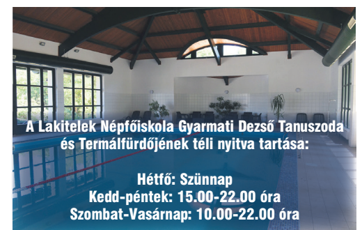
A Lakitelek Népfőiskola Gyarmati Dezső Tanuszoda és Termálfürdőjének téli nyitva tartása: