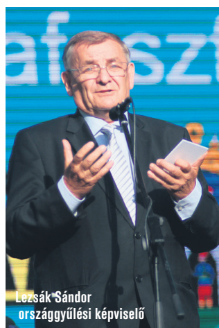
Lezsák Sándor országgyűlési képviselő