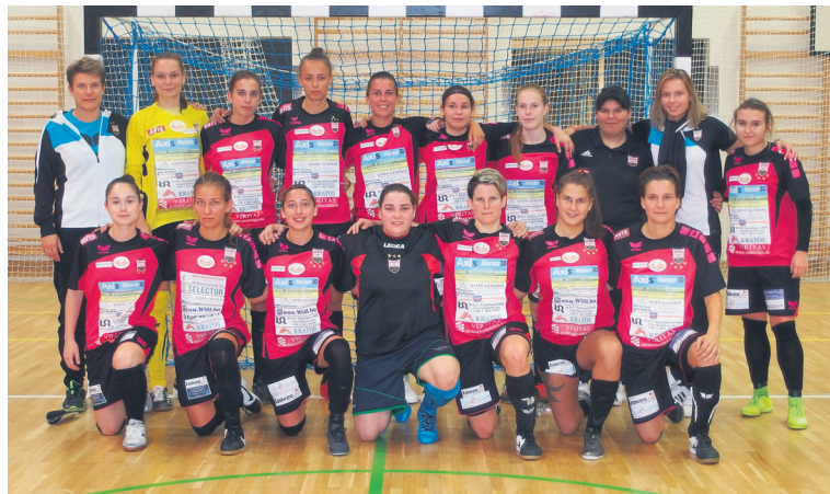
Astra Kiskunfélegyházi Bulls – Göcsej SK 5-2 (1-0)