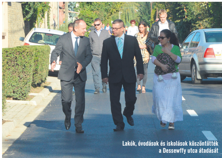
Lakók, óvodások és iskolások köszöntötték a Dessewffy utca átadását

Az új aszfalttal ellátott utca minőségét a városrész ovisai rolles, bringás körökkel, a józsefes diákok pedig futóversenyyel tesztelték, és láthatóan elégedettek voltak a minőséggel. Csányi József polgármester az átadás során a futóverseny versenyzőit oklevéllel és kupával jutalmazta, a jelen lévő utcalakók pedig az avatáskor