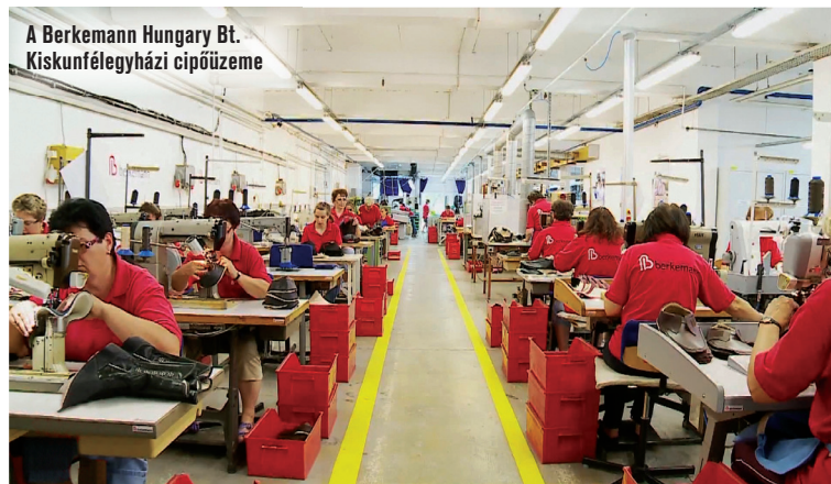
A Berkemann Hungary Bt. Kiskunfélegyházi cipőüzeme

Rendkívüli előnyt jelent függetlenségünk kivívása is: ma már magunk teremthetjük meg önálló egységként működő vállalatunk munkafeltételeit. Éppen úgy, ahogyan élhető munkakörnyezetünk kialakítása is kizárólag rajtunk múlik, a saját felelősségünk magunkat és egymást lelkesíteni.”