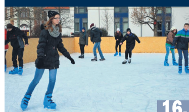
NYIT A JÉGPÁLYA