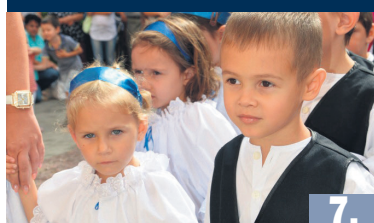
ITT A SZÜRET