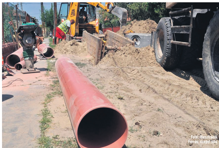
Fotó: Illusztráció Forrás: esepel.hu

A csatornázással kapcsolatos tudnivalókról e rovat hasábjain folyamatosan tájékoztatjuk a lakosságot.