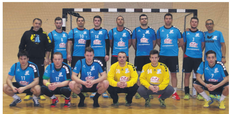
Sportszerkesztő: Gubu Zoltán

és az NB/I B-s Orosháza U23-as együttese vett részt. A felkészülési torna elődöntőjét magabiztosan nyerték a félegyháziak, a fináléban gólokban gazdag mérkőzésen 39-34-re az Orosháza fiataljai győztek.