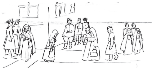
Yeller Zoltán utcai képi képekfelvételén 1945-ben katonák az órák közötti időben a delben, amikor az új tanítás mar.

Bár a tanítás megkezdődött 1945 januárjában, de mivel az iskolaépület még mindig az orosz katonák kezén volt, ezért kényszerűségből a helybeli iparos- és kereskedőtanonc iskolában és nagyobb magánházaiknál folyt az oktatás. 1945 nyarán Fazekas Mária Blandi-