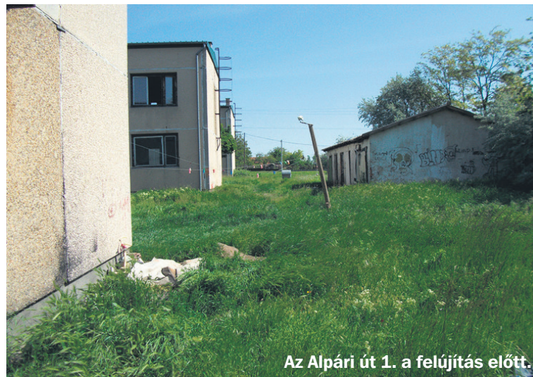
Az Alpári út 1. a felújítás előtt.