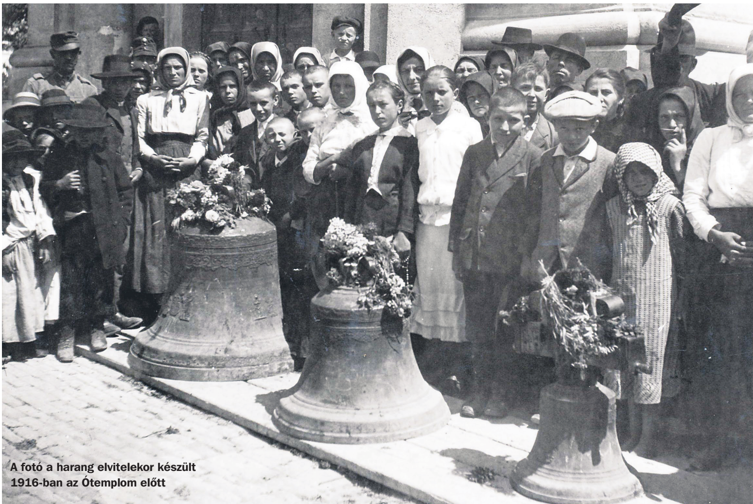
A fotó a harang elvitelekor készült 1916-ban az Ótemplom előtt