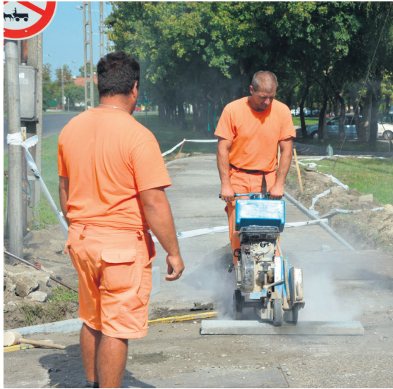
A projekt várható befejezése 2015. október 31, az elnyert KÖZOP-támogatás mértéke 138.017.250 forint.

Kiskunfélegyháza Város Önkormányzata „Kiskunfélegyháza, 5-ös számú főúton történő biztonságos kerékpározás megteremtése” elnevezéssel benyújtott pályázatával 100 százalékos támogatottság mellett mintegy 138 millió forint Európai Unió támogatást nyert.