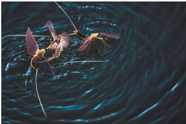
A Sajtófotó pályázaton díjazott kérész-sorozat egyik képe

textusban. Ilyen például a Kinizsi 100 teljesítménytúra a budai hegyekben. Ezek az emberek 24 óra alatt 100 kilométert tesznek meg. Számomra ők hősök. Ezt szeretném elmondani a fotóimmal. A Margitszigeten készítettem egy sorozatot Molnár Ákossal, akit sokan csak buborékbűvölőként ismernek. Nagyon izgalmas egyéniség, segítségével egy szívemnek kedves