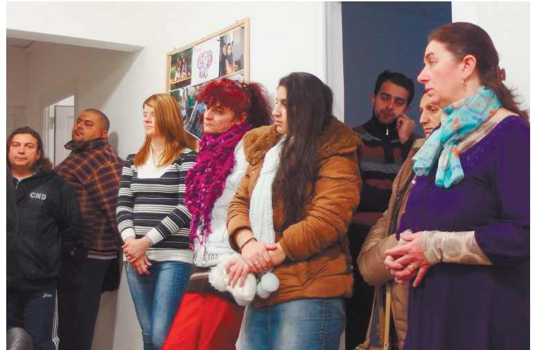
A felvétel a Csillag Szolgáltatópontban, az Álláskereső klub rendezvényén készült

– A Türr István Képző és Kutató Intézet programelemei közül a 7-8. osztályos felzárkóztató képzést az induló 12 főből 9-en, az építőipari képzést mind a 14 résztvevő, míg a parkgondozó képzést 12-ből 11-en teljesítették. Így összesen 34 bizonyítvány született eddig a Komplex telep-program keretében. A képzésbe bevont személyek mindegyikére készült kompetencia mérés is, ami az egyéni fejlesztési tervek alapjául szolgál.