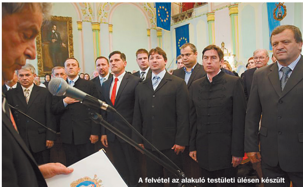
A felvétel az alakuló testületi ülésen készült