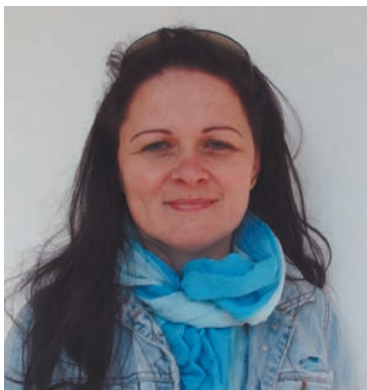
Edina (36) vállalkozó:

Mielőtt a félegyháziak végleg lemondtak volna róla, mégis újraindult. Nem reprezentatív körkérdeésünkkel a város egyetlen mozijának fogadtatására voltunk kíváncsiak.