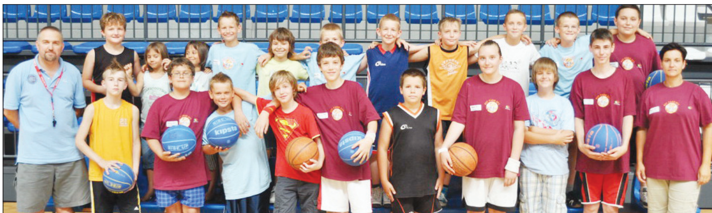
Egyhetes kosárlabdátáborot szervezett a 9-18 éves korosztály számára a Kiskunfélegyházi KC. A résztvevők az öt nap alatt a játék alapjait ismerkedhettek meg. A tábor célja a sportág népszerűsítése és az utánpótlás erősítése volt - tájékoztatta a Félegyházi Közlönyt Szabó Csaba táborvezető.