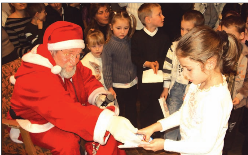
Gyermekzsivaltól volt hangos december 5-én a Nagyszöllő úti Gazdakör épülete. A hangzavarnak egyből vége lett, mikor megjelent a Mikulás, aki ajándékot hozott az aprónépnek.