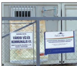
Víz- és Kommunális Kft. végzi.

Homokhátsági Regionális Települési Hulladékgazdálkodási Projekt részeként megépült létesítmény október 14-én megkezdte üzemserű működését. A létesítmény üzemeltetését a Városi